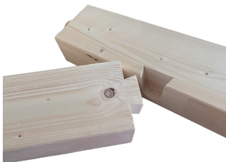
Schwabenschwanz-Verbindung mit Zulassung

Neugierig, wie die Maschinen arbeiten? Erkunde unseren Youtube Kanal!